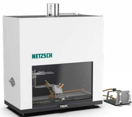
UL 94 Classic