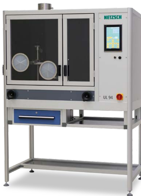
UL 94 Supreme