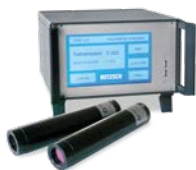
TRDA – Rauchdichtemessgerät mit Lichtmessstrecke