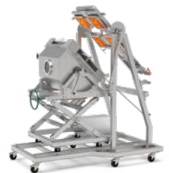
TDP T4 – Brandprüf- einrichtung für Dächer