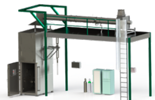
KBT 916 – Brandprüfeinrichtung für Kabelbündel