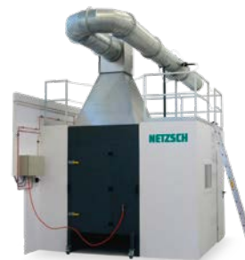
SBI 915 – Brandprüf- einrichtung für Bauprodukte