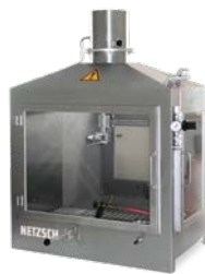
KBK 917 – Kleinbrennkasten