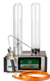
LOI 901 – Sauerstoffindex-Analysegerät