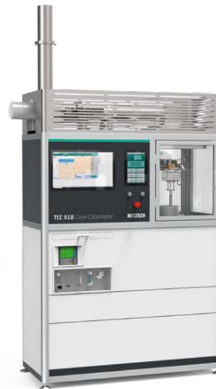
TCC 918 – Cone Calorimeter

Die richtige Auswahl von Materialien und Komponenten ist entscheidend für den Brandschutz und die Ausbreitung von Bränden. Brandprüfungen auf Basis deutscher, europäischer und internationaler Normen zur Einstufung der Entflammbarkeit und Flammenausbreitungsgeschwindigkeit von Materialien für die Bau-, Textil- Automobil- und Elektroindustrie unterstützen die Produktentwicklung. In Übereinstimmung mit den Produktnormen überprüfen NETZSCH-Geräte die Entflammbarkeit und tragen so dazu bei, eine schnelle Entzündung und Rauchentwicklung zu vermeiden.