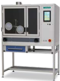
UL 94 – Brandprüf- einrichtung für elektro- technische Produkte