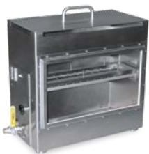
HBK 919 – Horizontalbrennkasten