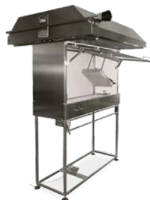
TBB 913 – Brandprüf- einrichtung für Bodenbeläge